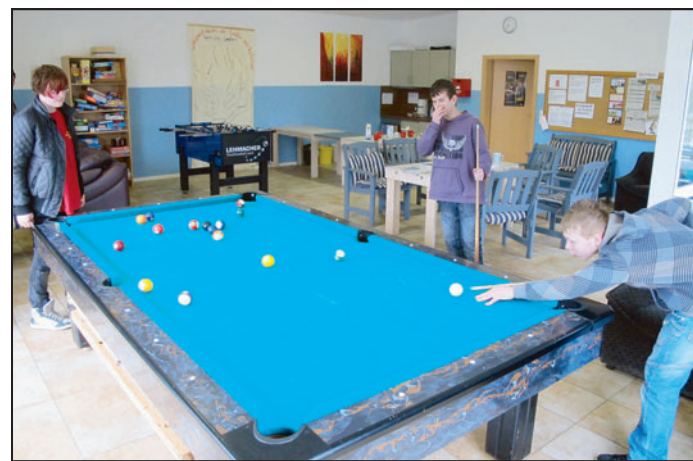
In der Schulstation und dem Jugendtreff gibt es vielfältige Angebote für Kinder und Jugendliche.

Auch die Vermittlung von sozialen Kompetenzen wie Teamarbeit und Klassenregeln und Hilfe bei der Berufsorientierung sind Aufgabe der Schulstation. „Wir helfen den Schülern bei dem Schreiben von Bewerbungen