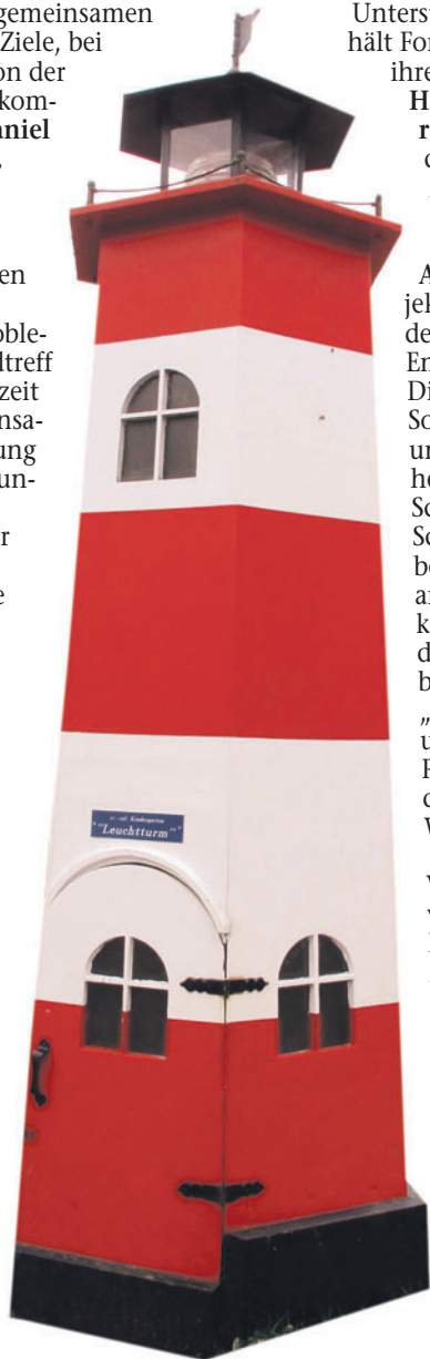
Den Spielplatz des Kindergartens „Leuchtturm“ in Wybelsum schmückt ein großer Leuchtturm.

„Die Zahl der Kinder und Jugendlichen, die in den Jugendtreff kommen, steigt kontinuierlich.“ Zimmermann ist besonders die aktive Mitgestaltung der jungen Menschen am Jugendtreff wichtig, da „sie dadurch ihren Ort besser schätzen lernen“. So gibt es eine Gestaltungsgruppe, die für den Ausbau der Inneneinrichtung zuständig ist. Zudem steht die erste Sitzung des neu entstandenen